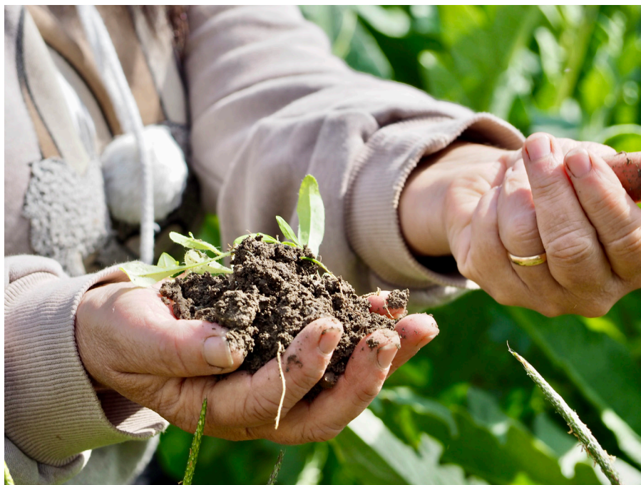
Fig. 2 - una manciata di terra da un campo di carciofi sull'isola di Sant'Erasmus. Ph Chiara Spadaro, 2021

vallino-Treporti, dove piccoli agricoltori adottano diverse strategie per sopravvivere ( fig. 2 ). Si tratta di piccole aziende a conduzione familiare, che nella maggior parte dei casi si affidano a pratiche convenzionali, ma tra cui non mancano esempi di sperimentazione biologica o agroecologica, nonostante il progressivo abbandono della terra da parte delle generazioni più giovani, attratte dalla più remunerativa economia turistica. Nella Laguna sud, invece, i rapporti tra parti umide e asciutte cambiano, sono più distanti e richiedono di attraversare un ampio specchio d'acqua e raggiungere l'isola di Pellestrina, prima di trovare la campagna.