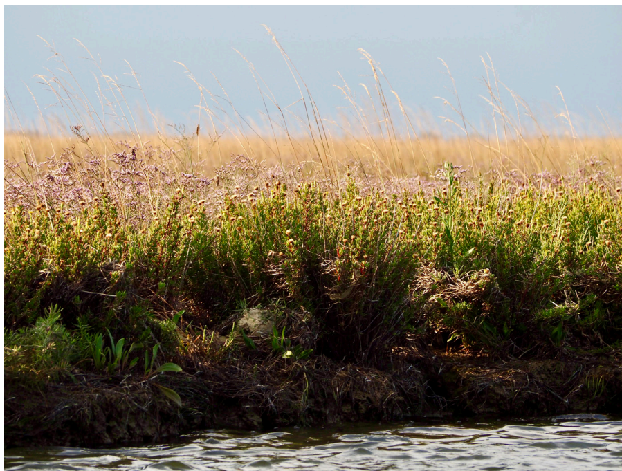
Fig. 1 - una porzione di barena fiorita, nella Laguna Nord. Ph. Chiara Spadaro, 2021

Dal punto di vista globale, scarseggia la terra coltivabile: il consumo di suolo, il land grabbing e anche il water grabbing hanno ridotto drasticamente terre e acque un tempo produttive (Liberti, 2015; Bompan e Iannelli, 2018; Krasna, 2019). E in molti casi, la terra rimasta è “scarsa”. Impoverita. Assetata. Stanca. In questo senso, nella Laguna di Venezia, un caso esemplare è quello del miele di barena. È un miele dal gusto salmastro